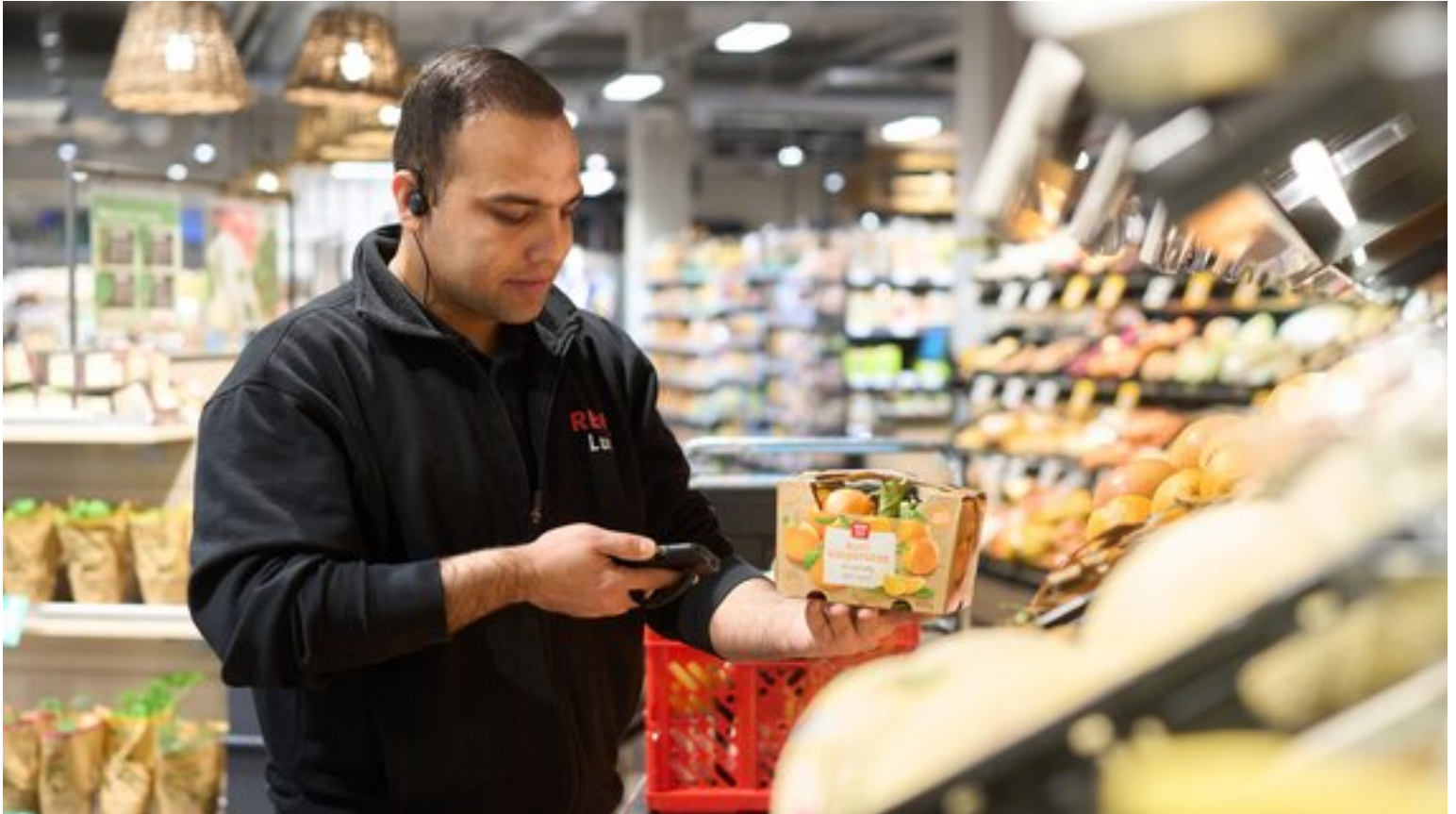
Ein Mitarbeiter des REWE-Markts in der Carl-Wery-Straße stellt die Artikel zusammen, die ein Kunde bestellt hat.