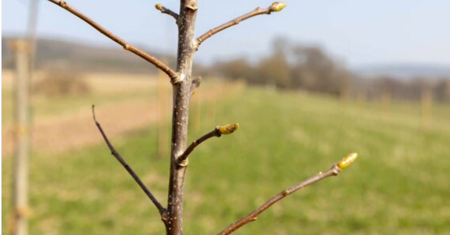
Die ersten Knospen kommen schon.