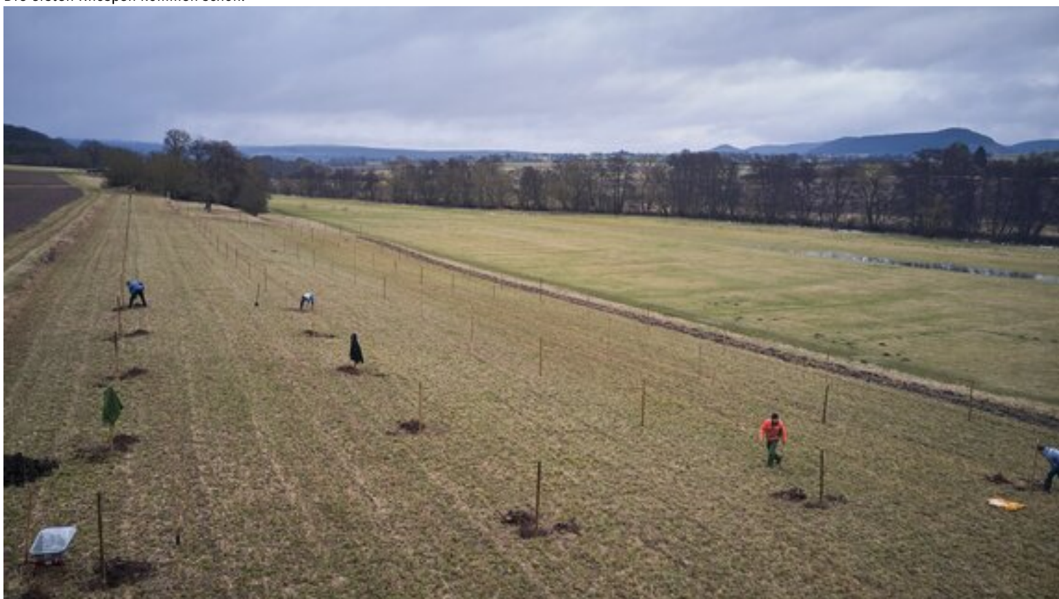
Die Musterstreubstwiese liegt idyllisch in Elfershausen bei Hammelburg.