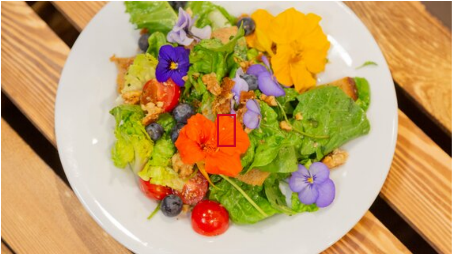
Die Vorspeise: Bunter Salat mit vielen frischen Kräutern und Brotchips.

Neugierig geworden? Dann werfen Sie einen Blick in die Videos unserer ersten Online-Ausgabe der Kochshow „Wir Landfrauen on Tour“: