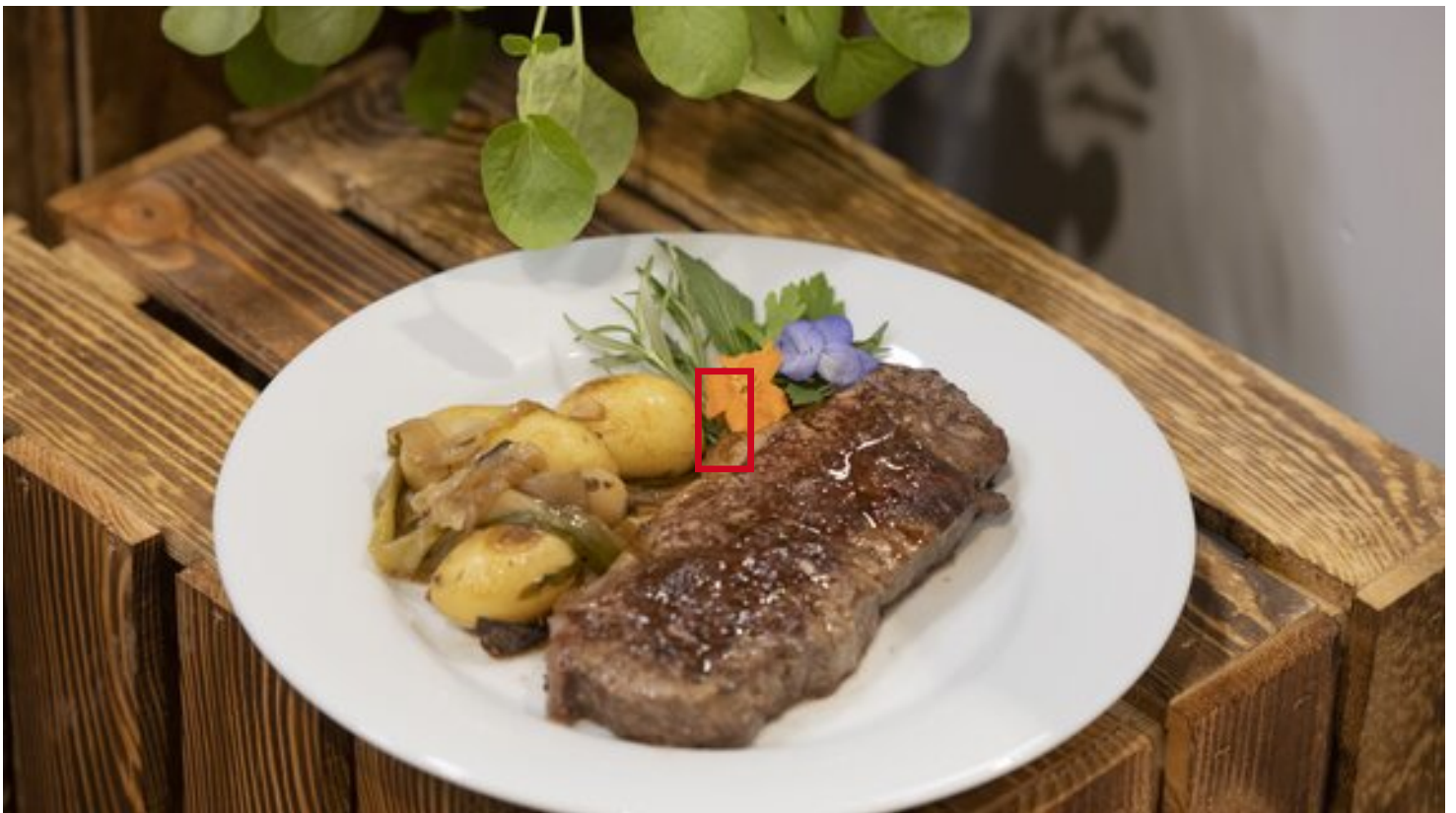
Der Hauptgang: Rindersteaks mit Kräuterkruste und Rosmarinkartoffeln.