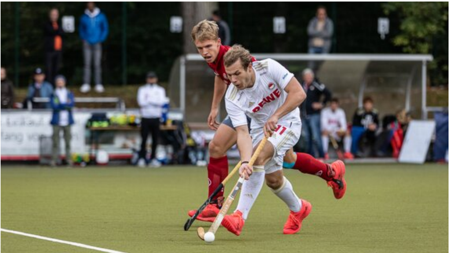
Nach einem spannenden Spiel endete die Begegnung zwischen dem Kölner Tennis- und Hockeyclub Stadion Rot-Weiss Köln e.V. und dem Club an der Alster Hamburg mit 2:2.