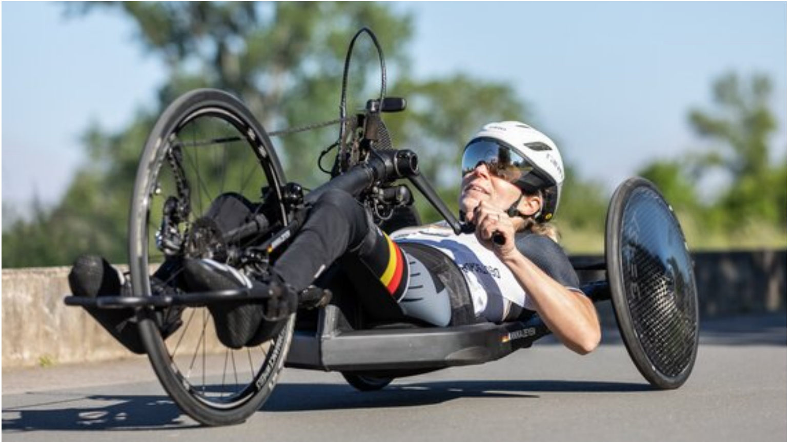
Die frischgebackene Weltmeisterin im Para Radsport freut sich bereits auf die Paralympics in Tokyo