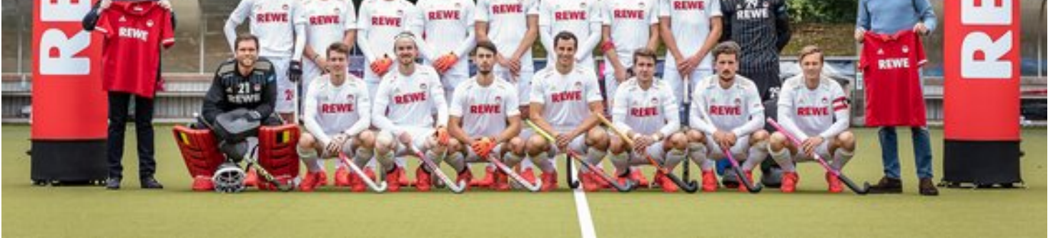
Die Hockey-Herrenmannschaft des KTHC in ihren neuen Trikots.