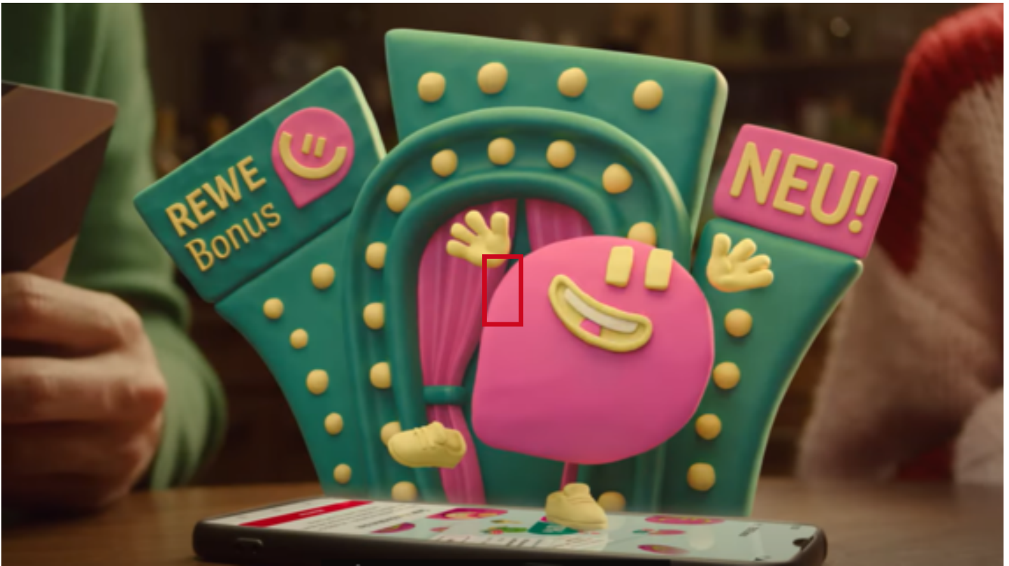
Der erste TV-Spot zu REWE Bonus.

Denn auch wenn Bo aus Knete ist und in der REWE App „wohnt“, hat er ein Zuhause in der realen Welt – bei einer Familie. Über die REWE App ist Bo immer zur Stelle und unterstützt die Familie im Alltag. Dabei kommen Spaß und gute Deals natürlich nicht zu kurz. Aus dem Nichts lässt Bo innerhalb von Sekunden Produkte und Coupons aus Knete entstehen, die den Kontext humorvoll unterstreichen. Wie das funktioniert, zeigt zum Beispiel der TV-Spot .