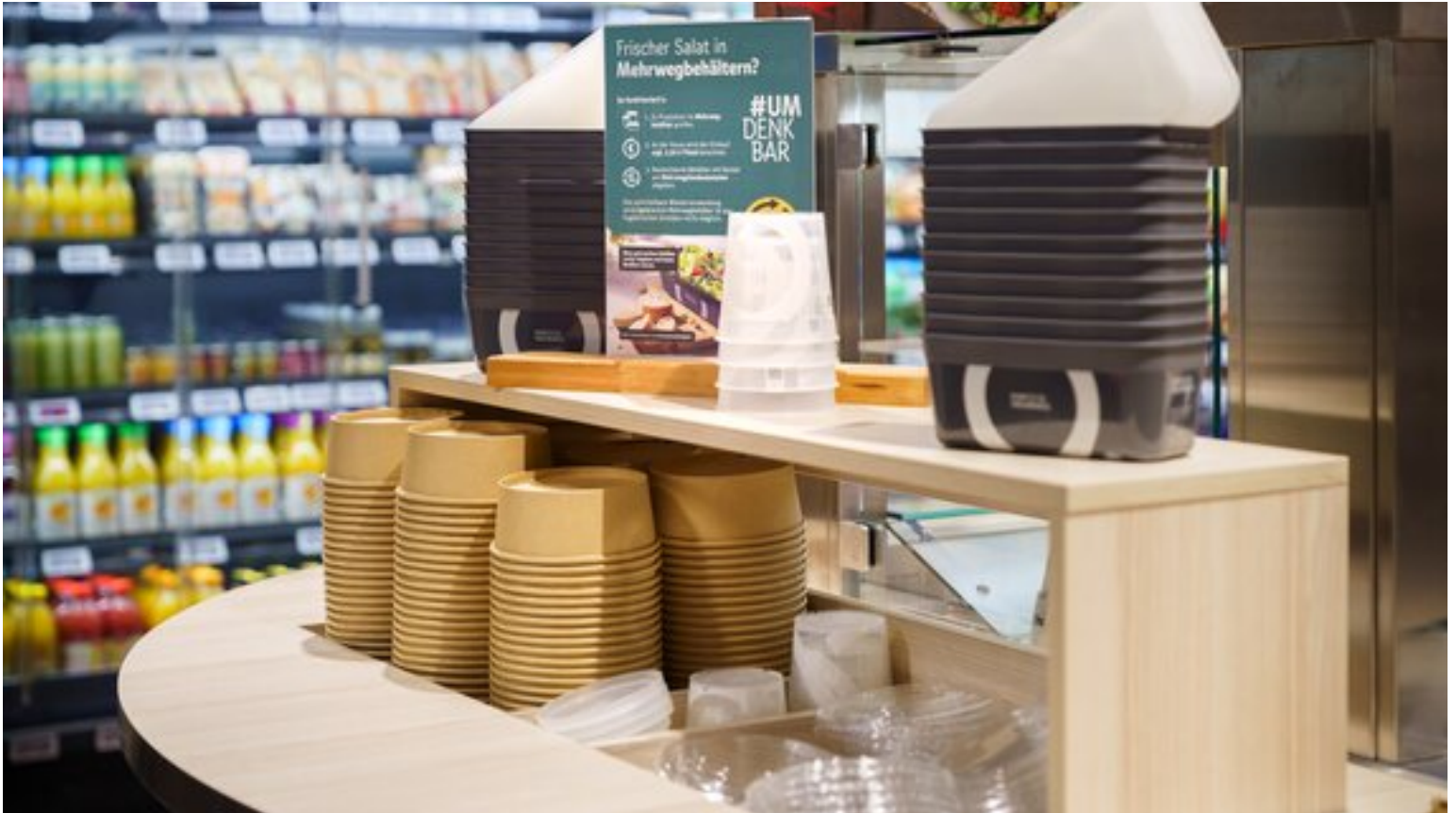
Die Kundschaft hat die Wahl: An der Salatbar können die Zutaten in Einweg- oder Mehrwegschalen abgefüllt werden.