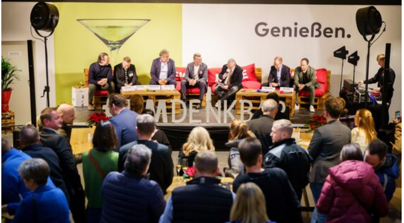
Bei der Neueröffnung des REWE Leipzig im NEO waren rund 300 Gäste anwesend.