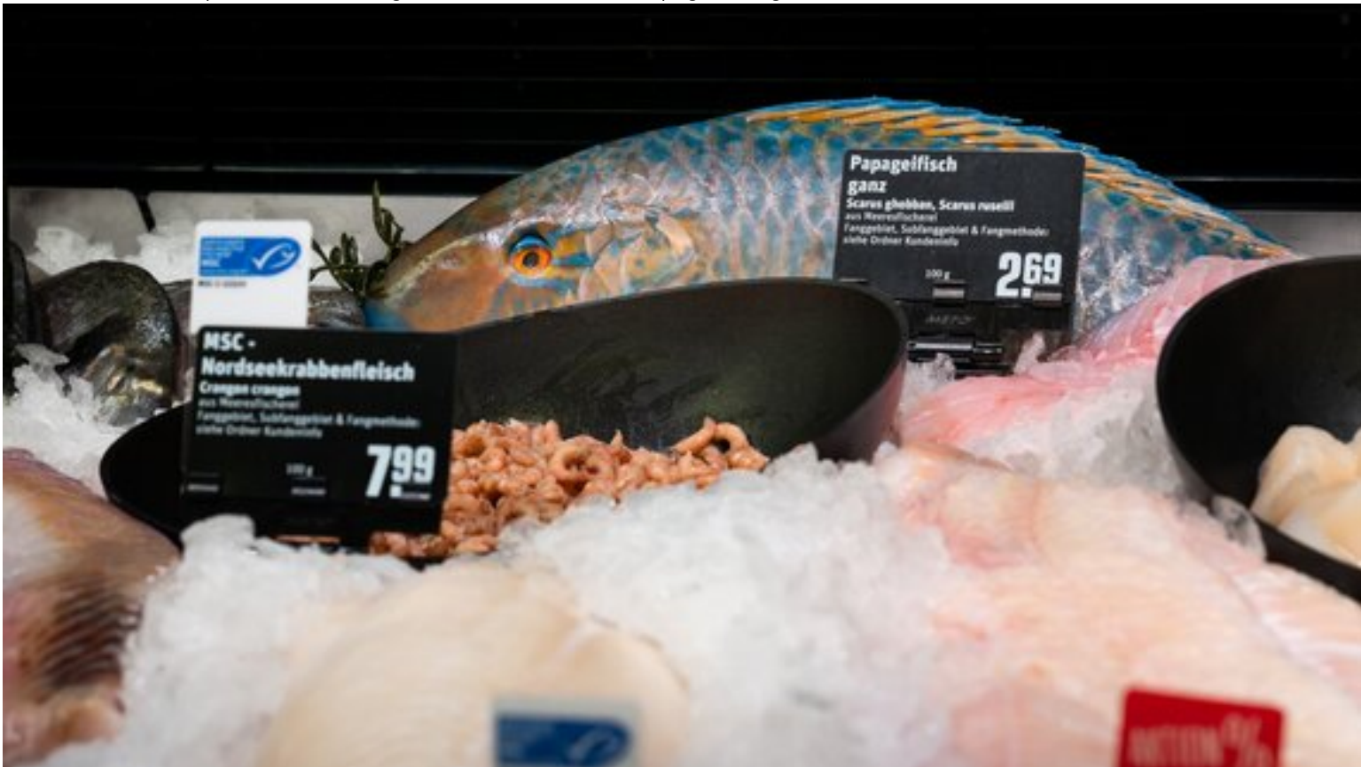
In der Frischfischtheke liegen neben Filets und Krabbenfleisch auch ganze Fische wie der Papageifisch.