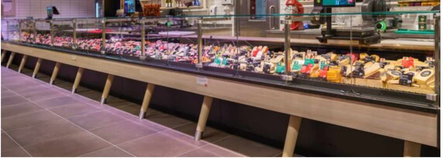
Beraten lassen und ausprobieren: An der langen Frischetheke im REWE Leipzig im Neo gibt es Frischfleisch, Fleisch- und Wurstwaren, Feinkost sowie Käse.