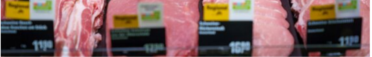
Das Schweinefleisch in der Bedientheke kommt in Leipzig von der Fleischmanufaktur Dietzel und hat die Haltungsform 4 (Premium).