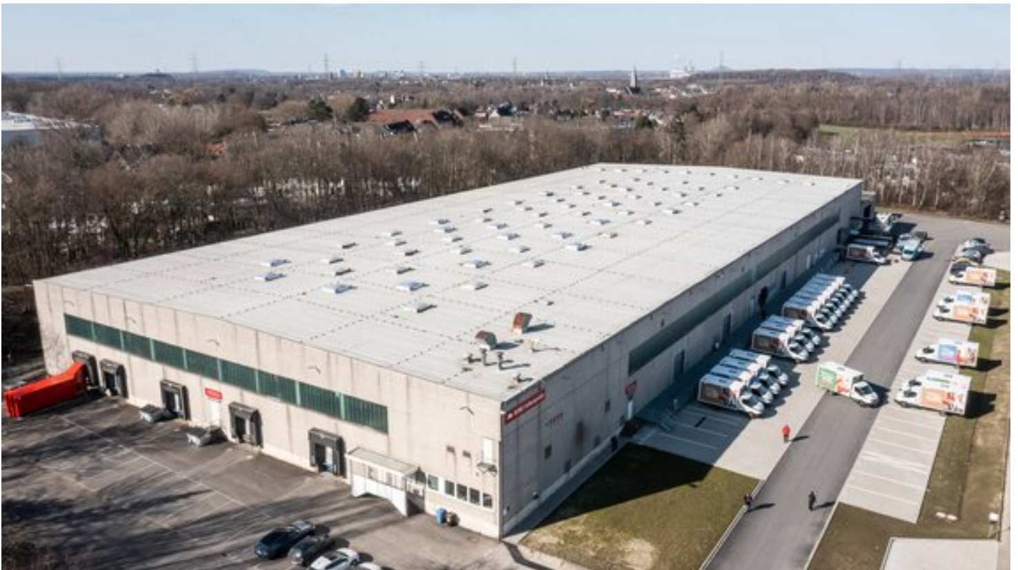
Das neue REWE Lieferservice-Food Fulfillment Center in Bochum-Wattenscheid

Head of Corporate Communications E-Commerce, Digital & Technologie und Mediensprecher